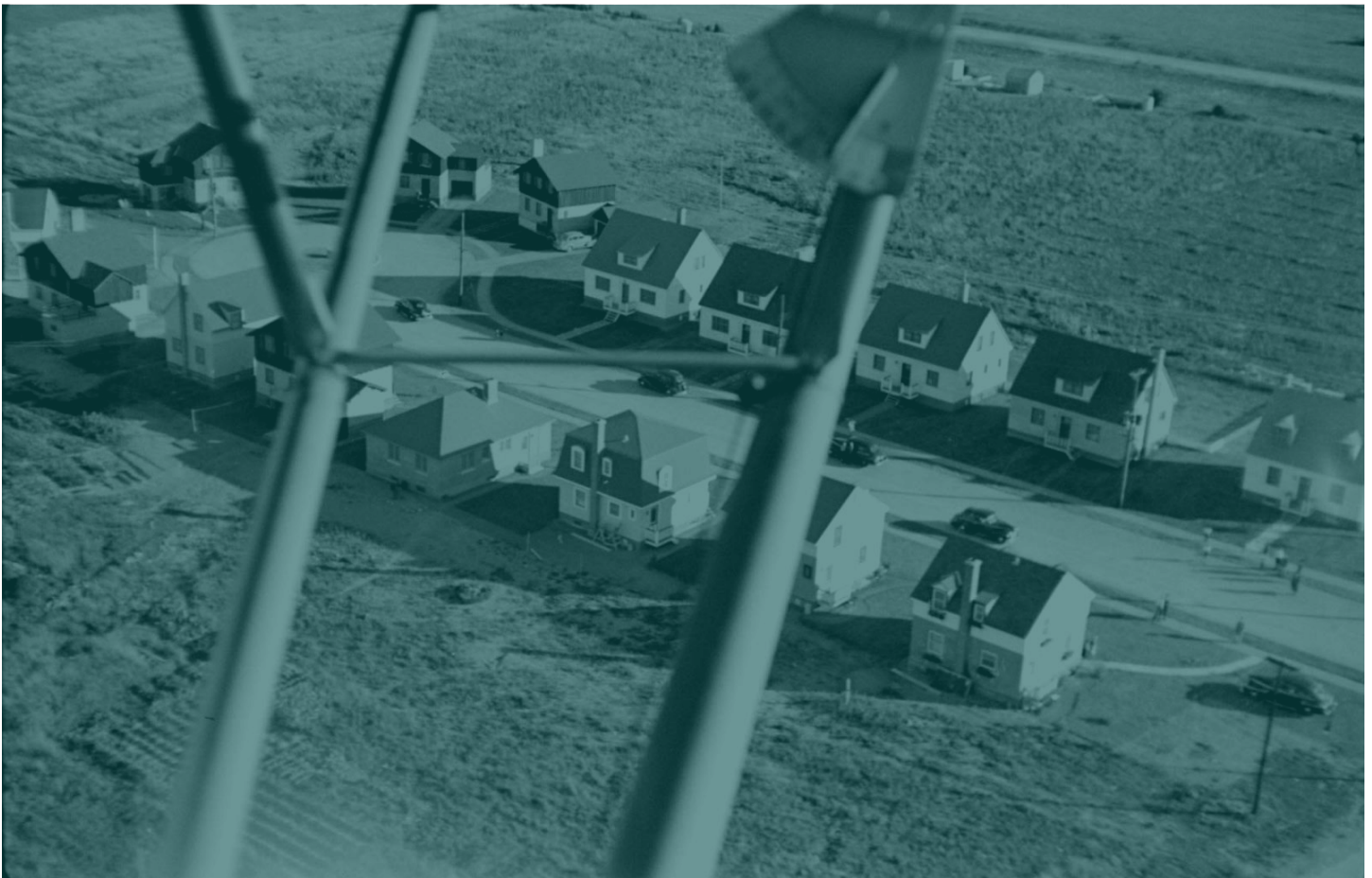
Avenue des Marronniers, août 1942