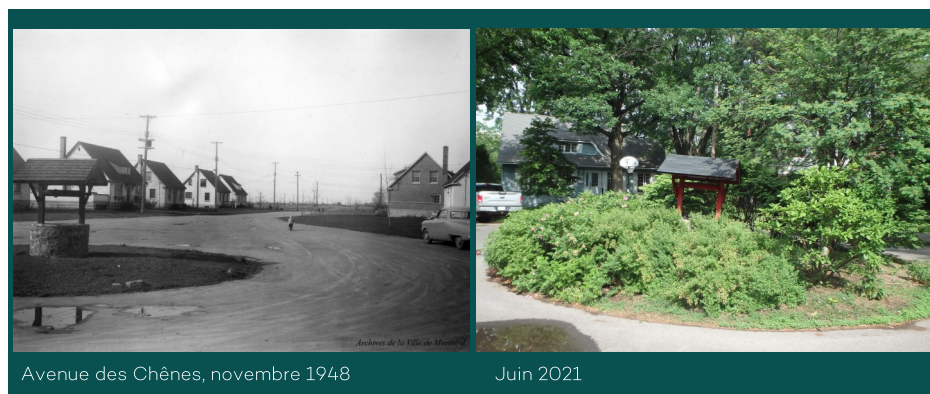
Avenue des Chênes, novembre 1948

Comme en fait foi cette photo prise en novembre 1948, la construction de ce puits date